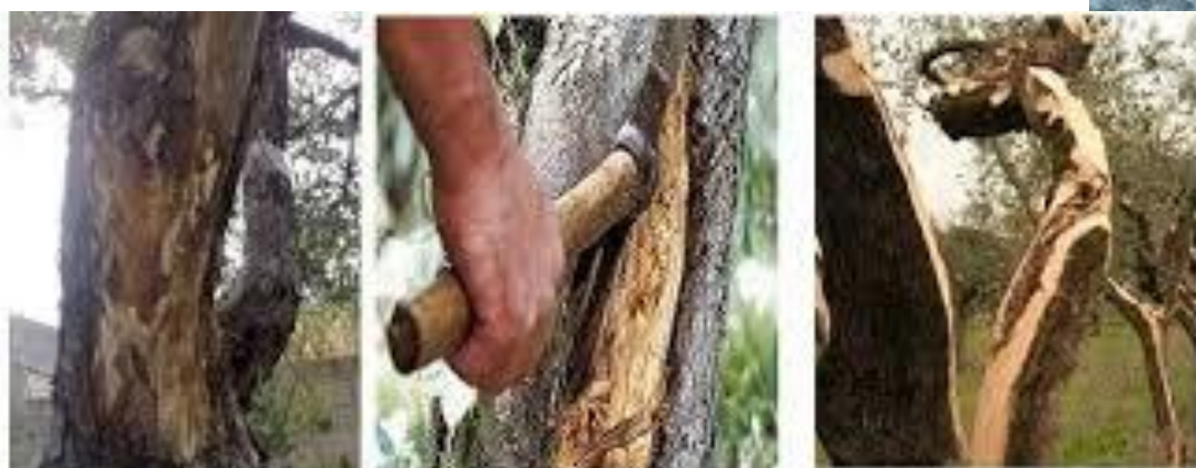
Olivo con presenza di carie. La sequenza delle foto illustrano le diverse fasi della "slupatura ossia la rimozione della carie dal tronco"

La parte sana andrà disinfettata con prodotti rameici e ricoperta con il mastice. La slupatura è un taglio straordinario che, se eseguito male, può rovinare o portare alla morte della pianta o all'ulteriore diffusione del fungo, è necessaria una certa maestria e non la si può improvvisare.