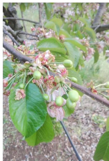
Varietà begareaux (Montecchia di Crosara)

Falena brumale ( Operophthera brumata ): è una farfalla che provoca allo stato larvale delle erosioni sui lembi delle foglie, che sembrano bucherellate e sui frutticini provocano un danno simile a quello dei ricamatori, le gemme sono, a volte, irrimediabilmente danneggiate all'interno.