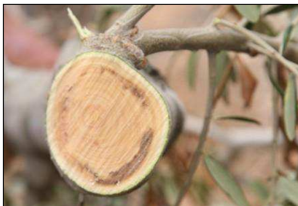
Figura 7: Imbrunimento dei vasi di una giovane branca e di un ramo di maggiori dimensioni