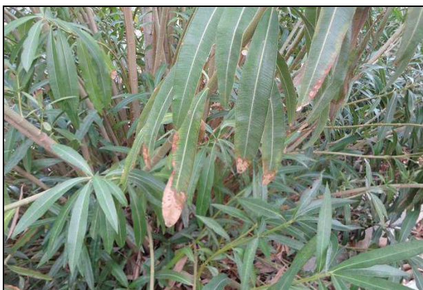
Figura 8: Sintomi su pianta di oleandro