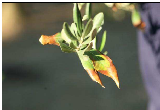
Figura 2: Disseccamento della porzione apicale e marginale della foglia