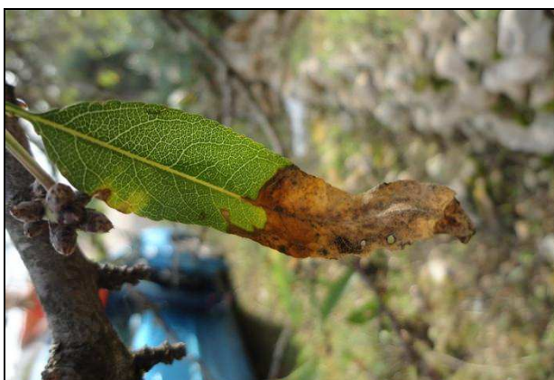
Figura 9: Sintomi su foglie di mandorlo