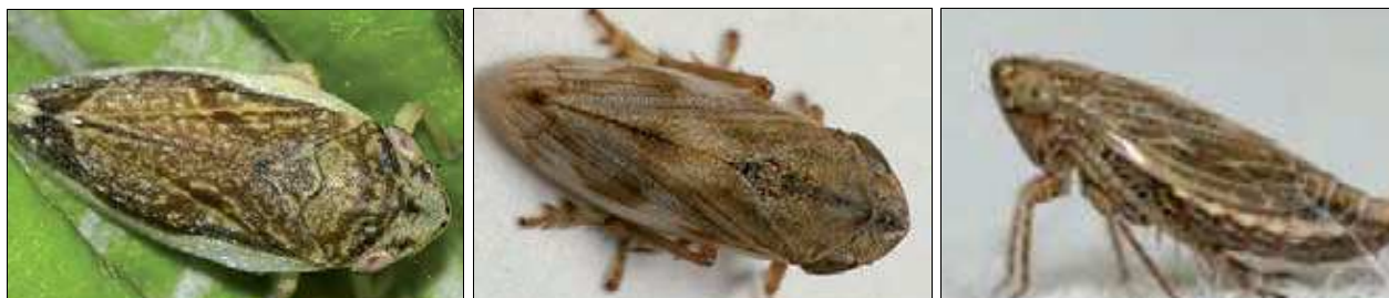
Figura 1: Da sinistra verso destra: Philaenus spumarius , Neophilaenus campestris e Euscelis lineolatus , alcuni dei possibili vettori di Xylella fastidiosa in Italia e in Europa (foto SFR Regione Puglia)

Indagini recenti evidenziano che un ruolo importante nella trasmissione del batterio è rivestito dalla Cicalina Philaenus spumarius – sputacchina media.