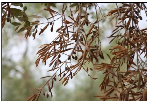
Figura 3: Repentino disseccamento di rami e drupe in accrescimento in seguito al proliferare del batterio nei vasi