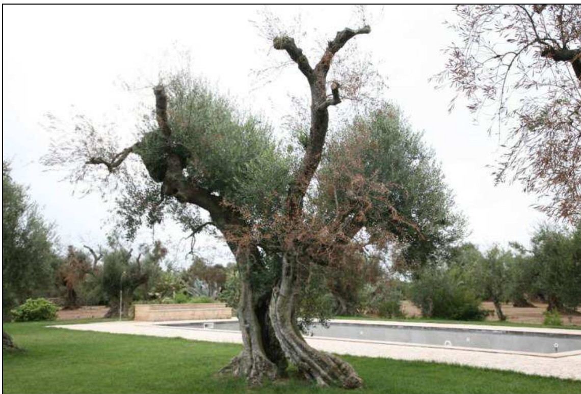
Figura 6: Sintomi su olivi allevati a scopo ornamentale, si profila un rischio di diffusione anche con la movimentazione di questi particolari esemplari