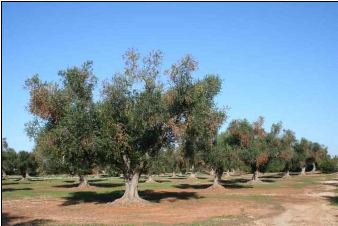
Figura 5: Panoramica su oliveto che mostra una sintomatologia diffusa

La possibile via di introduzione di X. fastidiosa in zone indenni è legata al commercio di materiale vivaistico infetto. Il batterio una volta introdotto in un'area si diffonde attraverso insetti vettori.